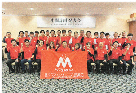
飲食業界を盛り上げるマツムラ酒販の従業員 ／中間計画発表会（2024年）で撮影